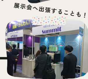
展示会へ出張することも！