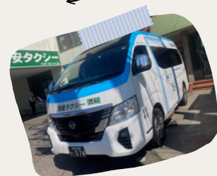
様々なタイプの車を運転します