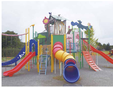
1 豊科南部総合公園 駐車場有 (約390台) 〒399-8204 豊科高家4882

令和4年にオープンした「ANCアリーナ」を含めた防災公園です。園内には、トイレ、テニスコート、大きな芝生広場、マレットゴルフコースなどがあり、さまざまな用途に活用されています。令和4年に噴水がリニューアルされ、夏は大人気の公園です。