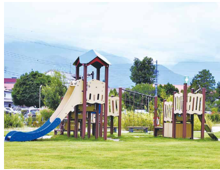
2 安曇野市防災広場 駐車場有 (約20台) 〒399-8201 豊科南穂高803

安曇野市役所の東側にある防災公園です。災害時には災害対策の支援拠点として、平常時には市民の憩いの場として利用されています。園内にはトイレ、芝生広場、舗装された広場があり、遊具も設置され、子どもも遊べる公園です。