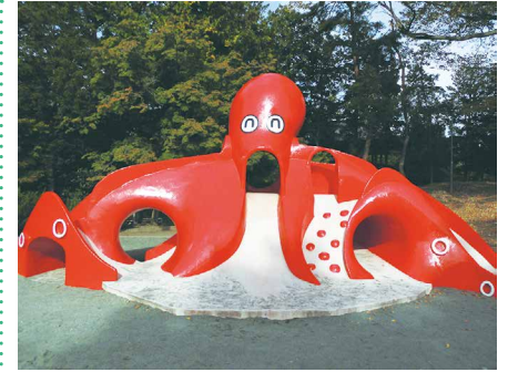
4 豊科公園 駐車場無 〒399-8205 豊科5719

安曇野市役所の南側に位置し、園内はトイレ、広場があり、まちなかにある高木に囲まれた自然豊かな公園です。タコの滑り台があり、通称「タコ公園」と呼ばれています。