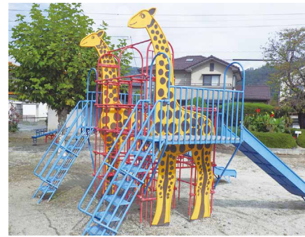
5 アルプス公園 駐車場無 〒399-8204 豊科高家3760-47

アルプス区にある公園で、園内にはトイレ、広場があり、地元の皆さんが植栽したきれいな花壇があります。大きなキリンのジャングルジム付き滑り台があり、通称「キリン公園」と呼ばれています。