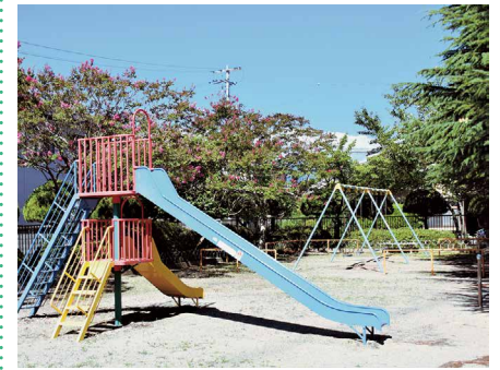
6 たつみ原公園 駐車場無 〒399-8204 豊科高家1137-87

たつみ原区にある公園で、犀川に隣接しており、園内にはトイレ、広場があります。高木に囲まれた自然豊かな公園です。