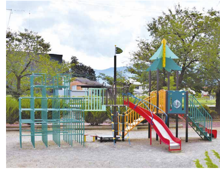
3 豊科中央公園 駐車場有 (約50台) 〒399-8205 豊科4425-1

豊科中央児童館に隣接した公園で、園内にはトイレ、大きな広場があり、いろいろなイベントに利用されています。また、園内にはビオトープや高木の植栽された築山もあり、春には桜も楽しめます。